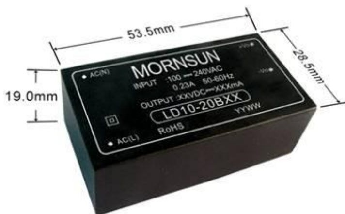
图 2 LD10 系列产品外形尺寸

安全性能好。该产品严格按医疗电源的要求设计。在安规设计上，输入和输出之间留有足够的安全距离，并且输入和输出之间耐压达到 4000VAC/1min。输入对输出的漏电流也很小，其中 LD05 系列内部无安规电容设计，使得漏电流几乎为零；LD10 系列也仅为 100uA 以下。LD05、LD10 系列电源已通过 EN60601 的医疗认证（证书号分别是：E/CE2995090218023、E/CE3180090723209）和 UL60950 的安全认证（证书号分别是：E235235-A17-UL-1 和 E235235-A18-UL-1）。